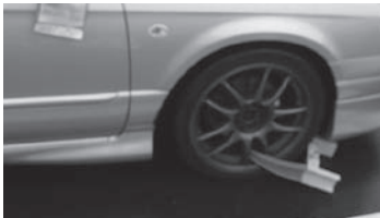
自家用車の差押処分

市では、やむを得ない理由で一時的に税金の納付が困難な人と悪質な滞納者を見極め、財産調査（預金調査・不動産所有状況調査・勤務先へ給与支給状況調査等）を行っております。悪質な滞納者に対しては、財産が見えられた場合、預貯金などの金銭は取立し、不動産や自動車などについては、公売（売却）により換価