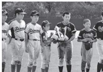
中山公兜杯争奪戦 スポーツ少年団が交互に行き来をして交流