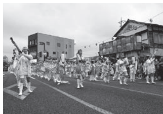
高萩まつりに飯能市民が参加