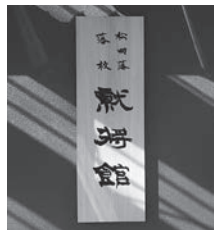
就将館の看板は西川材で有名な飯能市から寄贈されたものです