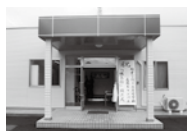
明秀学園 高萩キャンパス「明高館」