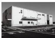
高萩市リサイクルセンター