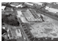
㈱HAX コーポレーション誘致