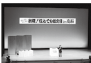
出張！なんでも鑑定団