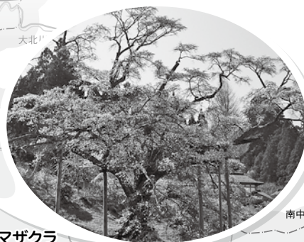
松岩寺のヤマザクラ