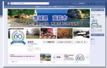
▲高萩市フェイスブックトップ画面

アドレス https://www.facebook.com/takahagicity