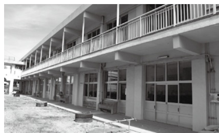
改築する現在の秋山小北側校舎

児童の学習・生活の場であるとともに、災害時には地域住民の避難場所としての役割も果たす学校校舎の改築事業。老朽化した秋山小学校の北側校舎を改築します。平成 27 年度までの継続事業で、総事業費は 2 億 461 万円。新校舎の概要は鉄筋コンクリート造（一部木造）2 階建てで床面積は 762 ㎡。普通教室 4 教室、児童クラブ 1（2 教室分）。