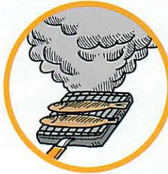
調理時の煙や湯気