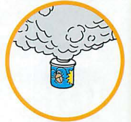
くん煙式殺虫剤など