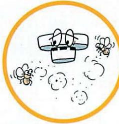
ホコリや小さな虫