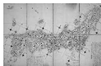
▲東洋学者ユリウス・ハインリヒ・クラプロート (Julius Heinrich Klaproth, 1783~1835) の遺品として購入した赤水図(初版)

五十一—八十年も遡る可能性が出てきた。それに加えて重要なのは、ティチングによって海外に持ち出された赤水図が、その後もヨーロッパの第一級の日本研究者によって日本に関する貴重な地理資料として大事に継承され、今日まで残っていたことである。