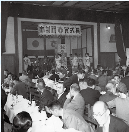
市制祝賀式典の様子

昭和29年11月23日に誕生した高萩市。 今月号は、市が保管している高萩市の風景写真などを現在の状況と比較しながら振り返ります。