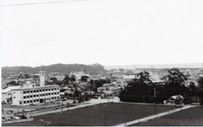
旧庁舎完成当時の市役所周辺

昭和二十九年に高萩町、松岡町、高岡村の二町一村と黒前村及び櫛形村の一部が合併して「高萩市」が誕生しました。高萩市は、戦前から林業・農業及び炭鉱を基盤として発展してきましたが、時代の変化を見越し、市誕生直後に製紙会社を誘致。さらに、学校や道路など基礎的な社会基盤の整備に努め、日本の高度成長とともに発展してきました。