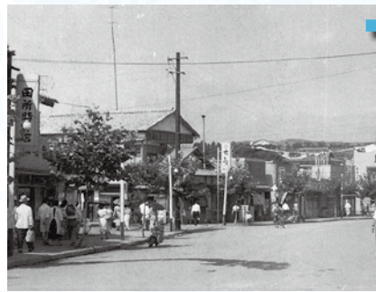
↑駅前通り 昭和29年8月撮影