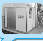
▲津波避難階段昇り口