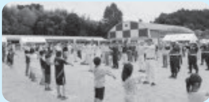
◀東北福祉大学考案「さんあい体操」エコノミークラス症候群を防止

メイン会場では、いざという時のために様々な訓練が行われ、多くの市民が体験しました。