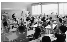
■学校用備品の整備 教育環境の充実を図るため児童用可動式机・椅子の購入費に充当