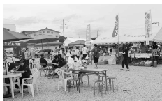
■アイラブ高萩・まちづくり推進経費 活気あふれるまちづくりを推進するため市民団体や事業に対する支援に充当