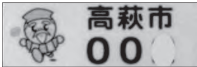
①防水反射素材シール(黄色)

認知症等の徘徊により行方不明になってしまふ恐れのある人を対象に、茨城県が作成した「おかえりマーク」を配布しています。外出先から自宅へ帰れなくなってしまうたり、警察に保護された時に備えて、「おかえりマーク」を靴や杖、衣服など身の回りの物に付けておくと、警察からの照会に対し、迅速にご家族へ連絡することが出来ます。 ▼対象者 高萩市徘徊SOS ネットワーク登録者 ※未登録の人は高齢福祉課にてご相談ください。