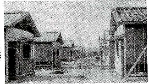
＝入居者を待つ市営住宅＝

長い投票券を握り、やや上気のケハイになつたコトも才一回目の印象に強く残るつぎの回にはややスレてきてラジオや街頭でやつてゐる演説をチヨクチヨク聞 いた。だから結果的にはマジメな人に票を入れることとあいなつたが世が静かになるにつれて、ソノ党を考へ始めた。それより一段と大人になつたヨウな気にな