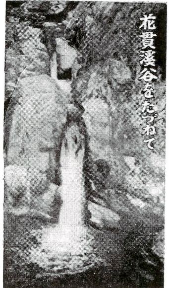
花貫溪谷をたづねて