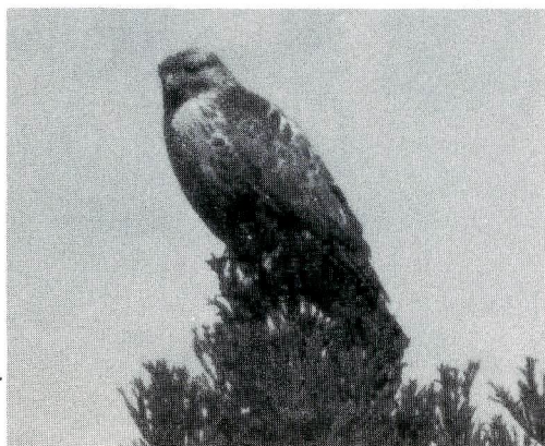
ノスリ（ワシタカ科）

二、完成後の生きた維持、管理こそ成功の鍵。 いま、全国に、「県民の」あるいは、「市民の」といった森が少なくない。三年くらいの期間にわたり、予算をかけて完成する。竣工式で祝杯を上げ、係りをきめて、すべてが終了する。悪口になるので、あまり書けないが、サラリーマン根性では、野鳥は対話してくれない。