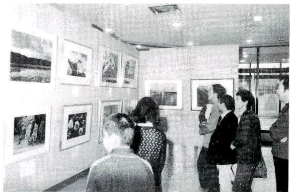
写真で見ました。自分が行けないところを

11月20日と21日、市民体育館と中央公民館前の駐車場で第4回産業祭が開かれました。地元企業や商店による即売が行われ、人気を集めました。農産物の即売では、新鮮な野菜が飛ぶように売れました。特に、プレゼントコーナーには、長い列ができ、目立ちました。 11月20日から24日、中央公民館と文化会館で文化祭が開かれました。文化への関心が高まりつつあるなかで、年々、技術も向上しています。これからの活発な文化活動が展開されていくことでしょう。