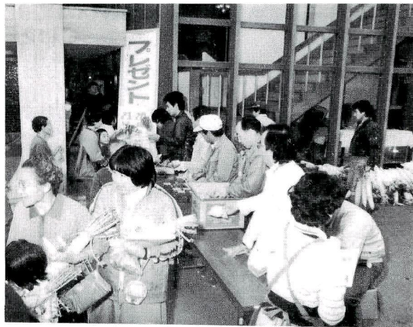
プレゼントされた大きな“大根”を持って