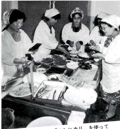
ネットで収穫された“コシヒカリ”を使って そうづくりに励む。