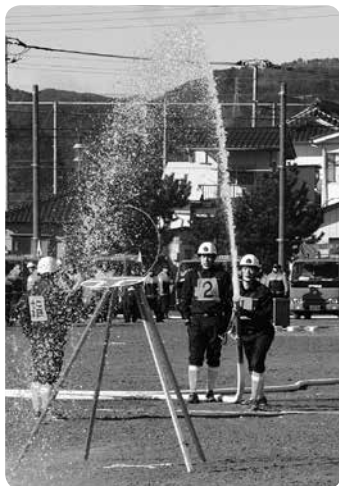
正確かつ機敏な動きで操法を披露する第 12 分団（下手側）