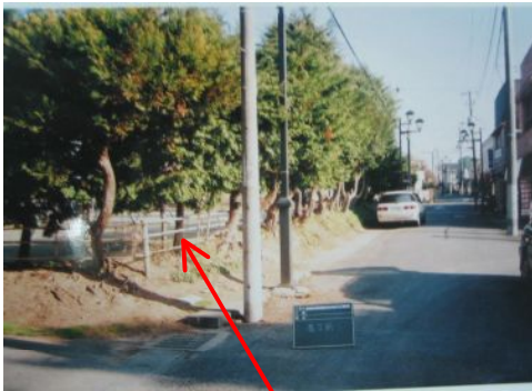
見通しの悪い植栽・土塁