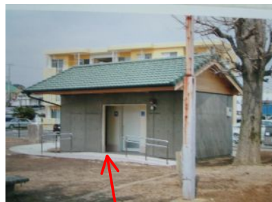
バリアフリースロープ