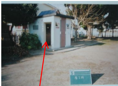
老朽化した旧トイレ