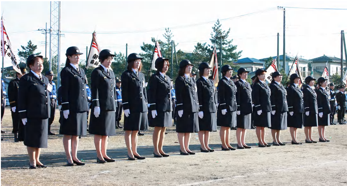
平成23年高萩市消防出初式 高萩市消防団本部付女性団員