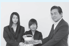
第一学院高等学校 2万566円

熊本地震の被災地支援として、高萩市内の児童生徒が自発的に募金活動を行い、集まった義援金は日本赤十字社、高萩市社会福祉協議会を通して熊本へ届けられました。