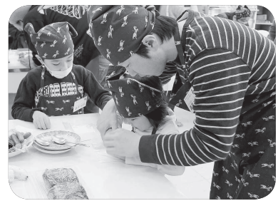
ハーモニーたかはぎが主催した父と子の料理教室の様子