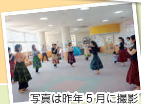
写真は昨年5月に撮影