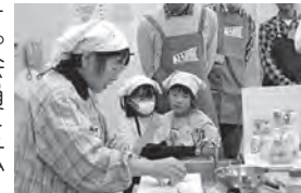
「お父さんと作る元気モリモリ簡単ご飯」の様子

「ハーモニータカはぎ」は、男女共同参画を推進する各種事業を実施している市民団体です。会員を広く募集していますので、お気軽にお問い合わせください。