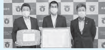
左から大部市長・関根校長・大内教育長