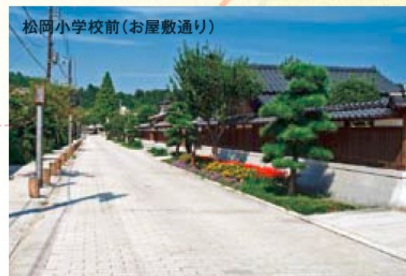
松岡小学校前(お屋敷通り)

市内には、2次救急医療機関に指定されている県北医療センター高萩協同病院のほか、14の医療機関が立地しています。小児科も高萩協同病院のほか、2医院が開設されており、安心に子育てをすることができます。