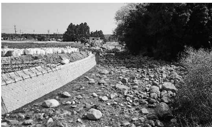
花貫川麦屋橋付近

る学校であると認識しております。そのためには、次の3点が必須であると考えています。1点目は、子供たちが安全・安心を実感できる場所であること、2点目は、確かな学力を身につけることができる場所であること、3点目は、子供たちを見守る周りの大人がしっかりと連携している場所であること。4月からは、より充実、連携しやすくなることを目指し、地域学校協働本部を立ち上げ、地域による学校の支援から、地域と学校双方向の連携協働並びに個別の活動から活動の総合化、ネットワーキ化を図ってまいります。