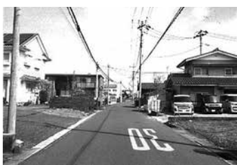
市道1403号線 (高萩駅東口～浜野町踏切)

質問 常会がないところで、組合をつくるかどうかどうかが非常に疑問である。市の責任で防犯灯を設置すべきである。