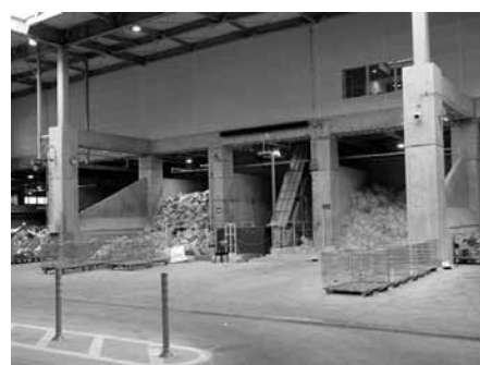
高北清掃センター

事務組合が管理運営する高北清掃センターへ搬入していただくこととなります。ごみ処理の手数料につきましては、家庭系一般廃棄物の場合、現行は10kgにつき200円としておりますが、4月1日からは、20kg以下は1回につき100円とし、20kgを超える場合は、10kgを超えるごとに100円ずつ加算させていただくこととなります。