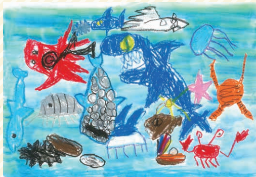
「海の生き物」 すずき えつし 鈴木 悦詩

お休みの日に水族館に行きました。 ぼくの大好きな海の生き物がいっぱい いて、仲良く泳いでいました。