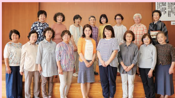
第1・3月曜日 10:00 ~ 12:00 ■連絡先 ☎ 22-5201 (代表 鈴木)

2020年3月、結成15年記念コンサートがコロナ感染症の影響で中止に。来月5日にゆうゆう十王Jホールで念願の開催を迎えます。久しぶりのステージを控え、初めて袖を通す衣装、白いレースのボレロにも胸を弾ませています。