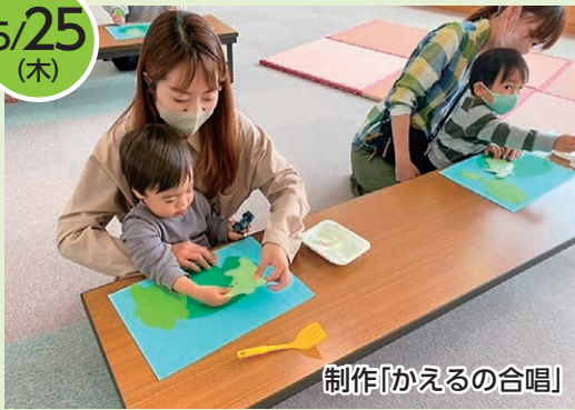
制作「かえるの合唱」

テープで貼ったり、クレヨンで描いたり親子で一糸懸命にかわいい「かえる」を制作しました。