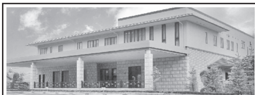
あいばるホール 高萩会館 ファミリーホール(家族葬) 高萩館 高萩市本町2-222 ☎0293-23-2000