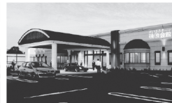
あいばるホール 磯原会館 ファミリーホール(家族葬) 磯原館 北茨城市磯原町豊田1205 ☎0293-42-8000