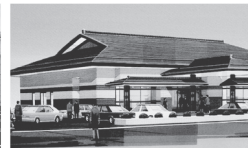
あいばるホール 大津会館 北茨城市大津町2670 ☎0293-46-6000