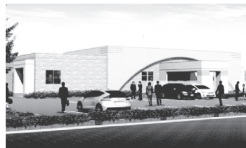
ファミリーホール(家族葬) 中郷館 北茨城市中郷町下桜井1031 ☎0293-42-1000