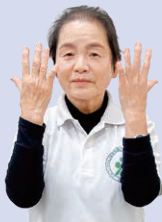
① 両手のひらを内側（顔）に向ける。