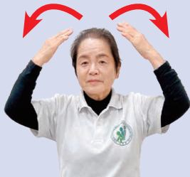
② 両手を顔の前で、顔を洗うように回す。