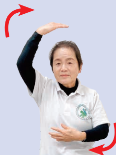
④ そのまま両手を逆方向に回しながら、顔の方に戻していく。