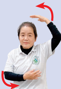
③ 頭の後ろの方まで大きく交互に回し、一旦止める。