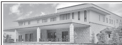
あいぼるホール 高萩会館 ファミリーホール(家族葬) 高萩館 高萩市本町2-222 ☎0293-23-2000