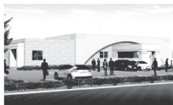
ファミリーホール(家族葬) 中郷館 北茨城市中郷町下桜井1031 ☎0293-42-1000