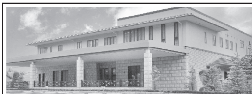
あいばるホール 高萩会館 ファミリーホール(家族葬) 高萩館 高萩市本町2-222 ☎0293-23-2000