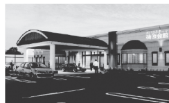
あいばるホール 磯原会館 ファミリーホール(家族葬) 磯原館 北茨城市磯原町豊田1205 ☎0293-42-8000