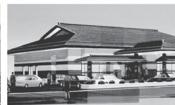
あいばるホール 大津会館 北茨城市大津町2670 ☎0293-46-6000