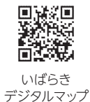
いばらき デジタルマップ