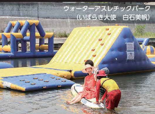
ウォーターアスレチックパーク (いばらき大使 白石美帆)