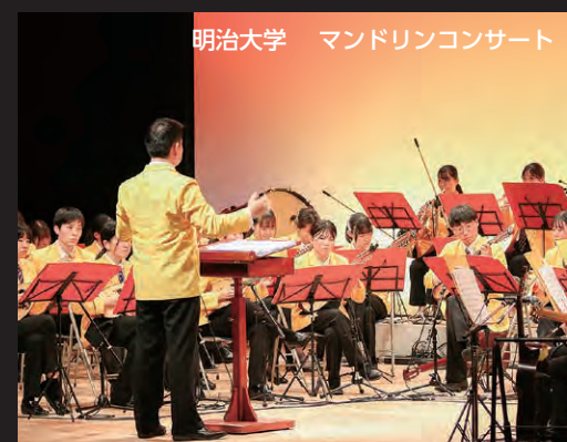
明治大学 マンドリンコンサート