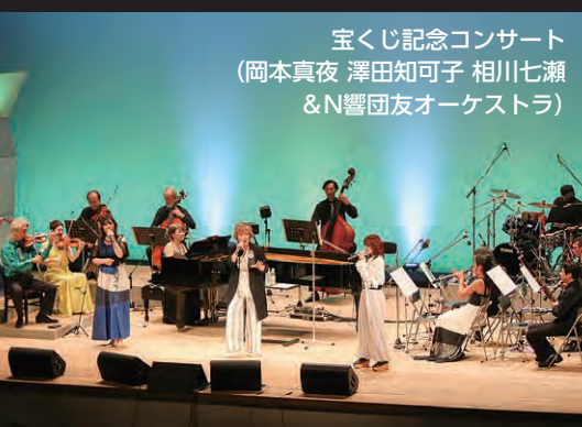
宝くじ記念コンサート (岡本真夜 澤田知可子 相川七瀬 & N響団友オーケストラ)