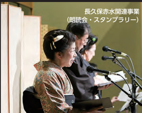
長久保赤水関連事業 (朗読会・スタンプラリー)