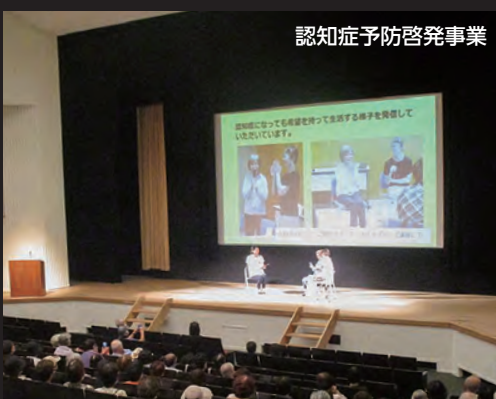
認知症予防啓発事業