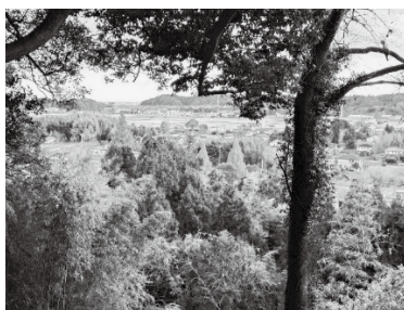
竜子山からの眺望 (太平洋左上)

産業建設部長 令和7年3月の基金残高見込みにつきましては、約1億521万6千円となります。