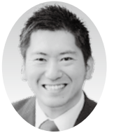
大平 望 議員