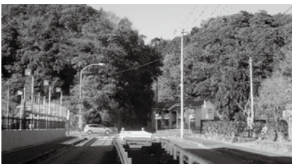
義務教育学校施設建設候補地4 瀧神社周辺 東側市街地方面から望む

教育部長 昨年度に策定した高萩市立小中学校適正規模・適正配置実施計画においては、概算費用として36億5800万円と想定しています。が、人件費、建設費、資材等の高騰により、整備費用については、増えるものと考えます。