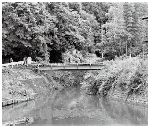
下手綱 関根川の横町橋

産業建設部長 撤去設計委託料について、令和6年第2回定例会で補正予算を議決いただき、その業務が11月末に完成したことに伴い、撤去工事を河川の流量が少なくなる冬季、いわゆる濁水期に工事を実施するため、補正予算を提案させていただきました。