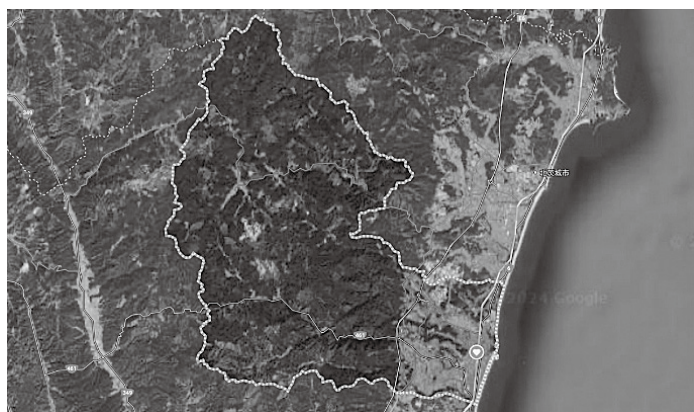
高萩市の Google マップ航空写真

企画総務部長 平成26年3月に策定したグリーンタウンでつなぐ粗造成地活用計画を基本に、平成29年3月からグリーンタウンでつなぐ防災運動広場整備基本計画策定委員会により検討を開始しましたが、市の厳しい財政状況や公共施設管理計画により平成30年11月をもって休止してまいりました。その後、子育て支援住宅用として検討を進めてまいりましたが、事業者側から採算面で事業化は困難との回答でした。市としても、グリーンタウンでつなぐ粗造成地の利活用は、喫緊の課題であると認識しています。 質問 家庭菜園や農地として貸し出すというのはどうでしょうか？