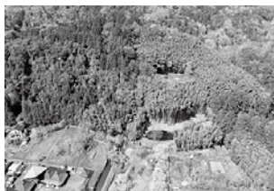
竜子山城・松岡城跡全景

質問 2018年から竜子山の竹林伐採等の整備を進めており、本丸跡等の主な建物跡の整備はほぼ終了しています。また、山頂を経由して一周できる回遊コースの歩道整備も進んでいます。しかし、課題は竹の繁茂です。竹の伐採を強化する必要があり、市からの支援が必要不可欠と考えています。ボランティア団体の皆様からの強い要望であります。竹木の伐採等について伺います。