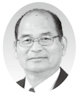
大森 要二 議員