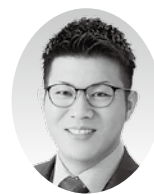
畠山 結樹 議員