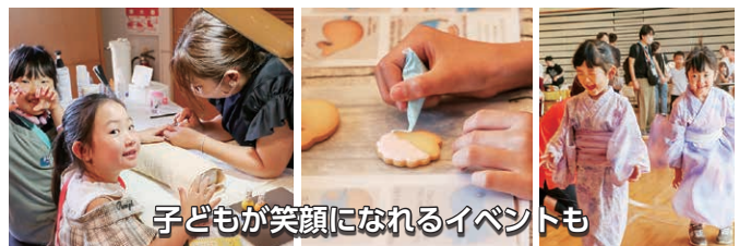
子どもが笑顔になれるイベントも