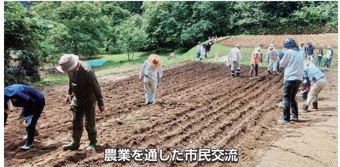
農業を通じた市民交流