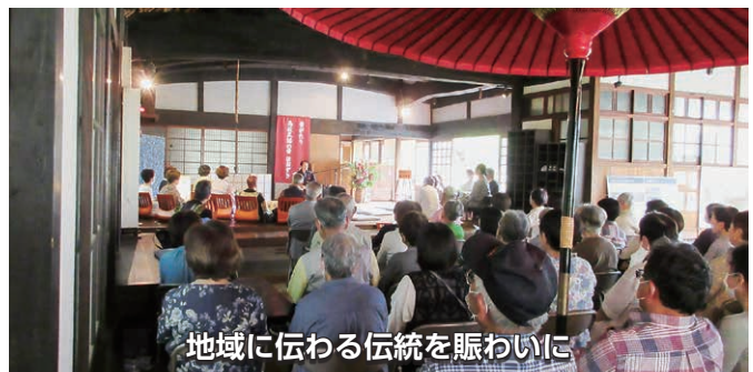
地域に伝わる伝統を賑わいに