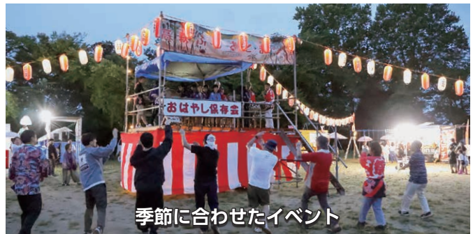
季節に合わせたイベント