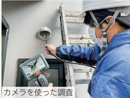
カメラを使った調査