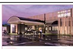
あいばるホール 磯原会館 ファミリーホール(家族葬) 磯原館 北茨城市磯原町豊田1205 ☎0293-42-8000