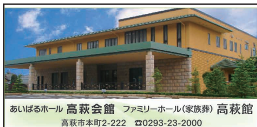
あいばるホール 高萩会館 ファミリーホール(家族葬) 高萩館 高萩市本町2-222 ☎0293-23-2000