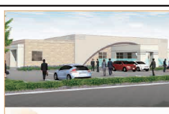
ファミリーホール(家族葬) 中郷館 北茨城市中郷町下桜井1031 ☎0293-42-1000