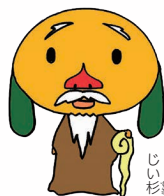
はぎまろと愉快な仲間たち