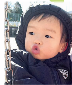
走るのが大好きな男の子です！